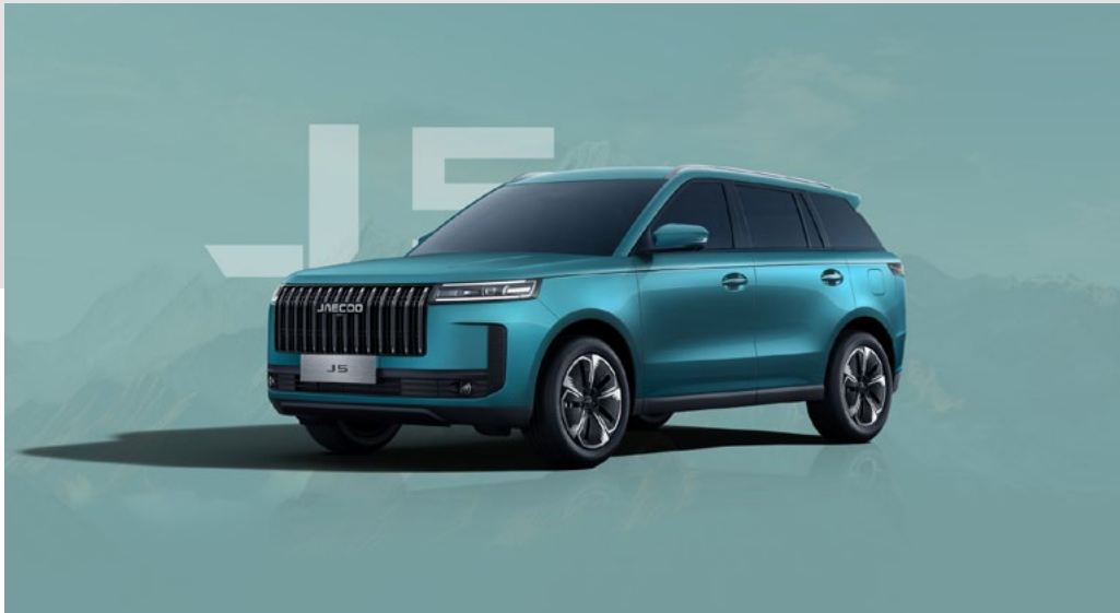
EUCALYPTUS GREEN (LQ)