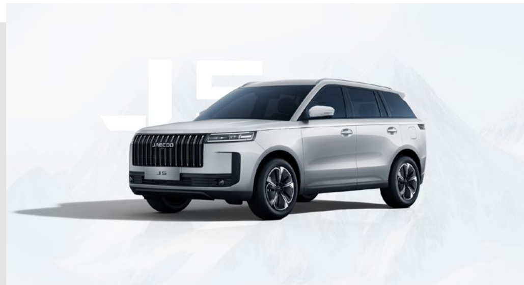
SNOW WHITE (BW)