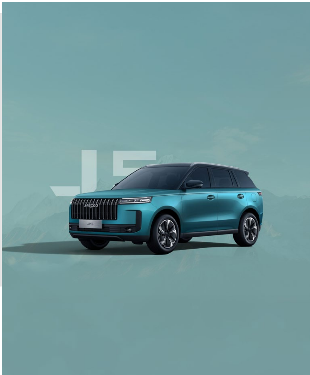
EUCALYPTUS GREEN Z CZARNYM DACHEM (Z6)