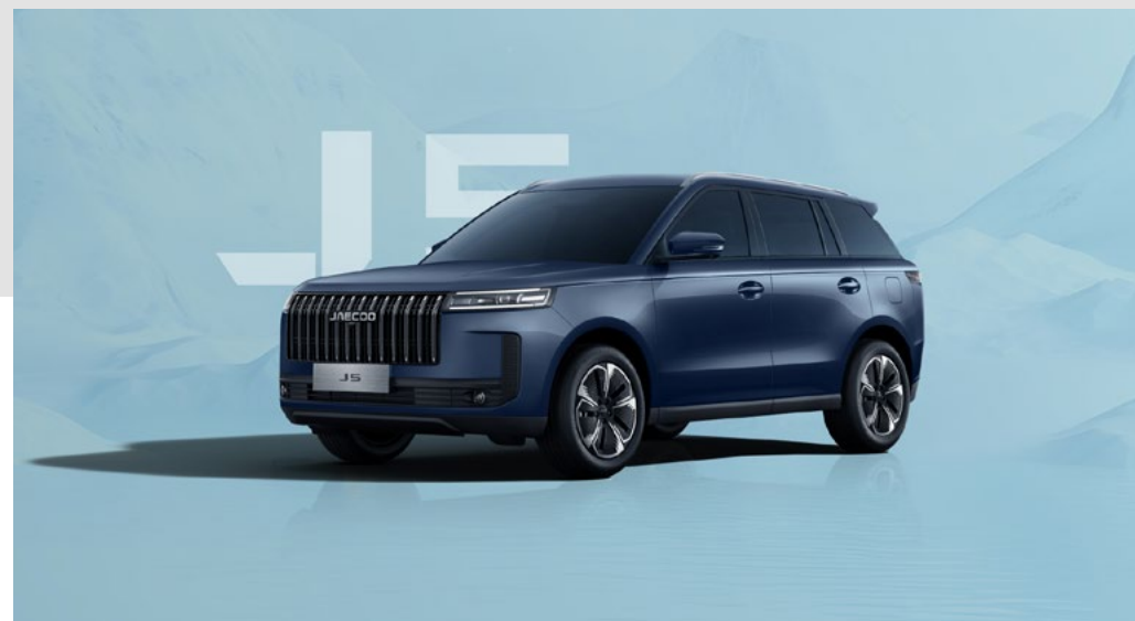
GLACIER BLUE (WS)