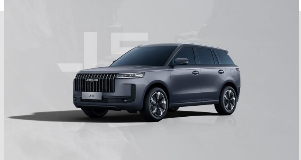
STONE GRAY (GV)