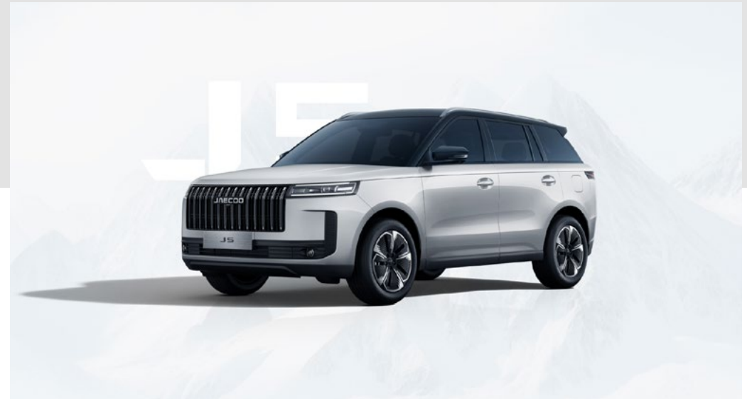
SNOW WHITE Z CZARNYM DACHEM (ZE)