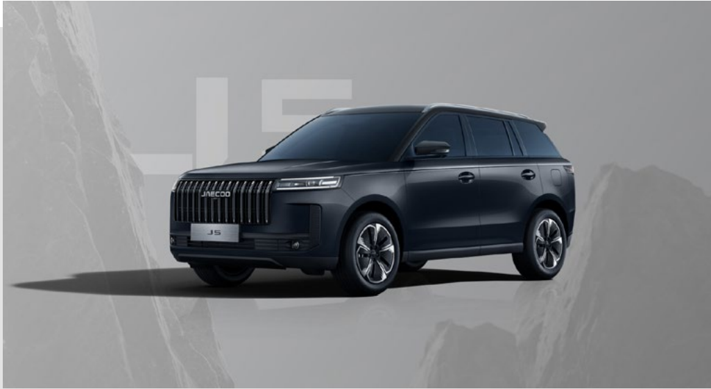
CARBON BLACK (CL)